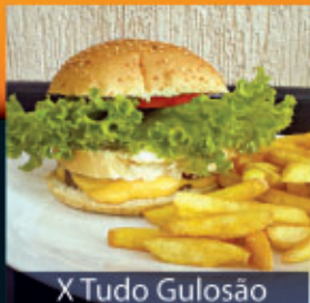
X Tudo Gulosão