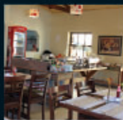
Restaurante Dedo de Moça

mercado de trabalho e a ascensão da classe C contribuíram para este aumento.