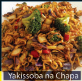
Yakissoba na Chapa