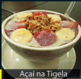
Açaí na Tigela