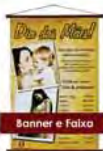
Banner e Faixa

Av. São Sebastião, 126 - Centro - Ibiúna - ☎(15) 3241-2051 ibiuna@tesourolaser.com.br www.tesourolaser.com.br