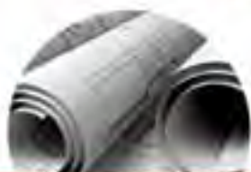
Cópia e Impressão de Plantas de Engenharia