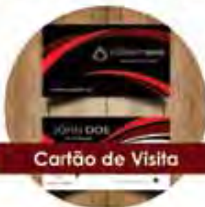
Cartão de Visita